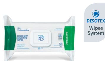
DESCOCEPT SENSITIVE WIPES