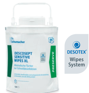
DESCOCEPT SENSITIVE WIPES XL

DESCOCEPT SENSITIVE WIPES sind alkoholische, gebrauchsfertige Tücher zur materialschonenden Desinfektion und Reinigung von Medizinprodukten, medizinischem Inventar sowie Flächen aller Art in patientennahen Bereichen.