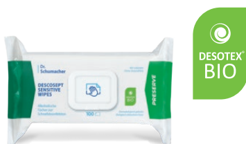
DESCOCEPT SENSITIVE WIPES