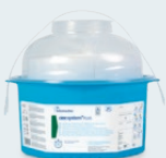
ONE SYSTEM+ PLUS